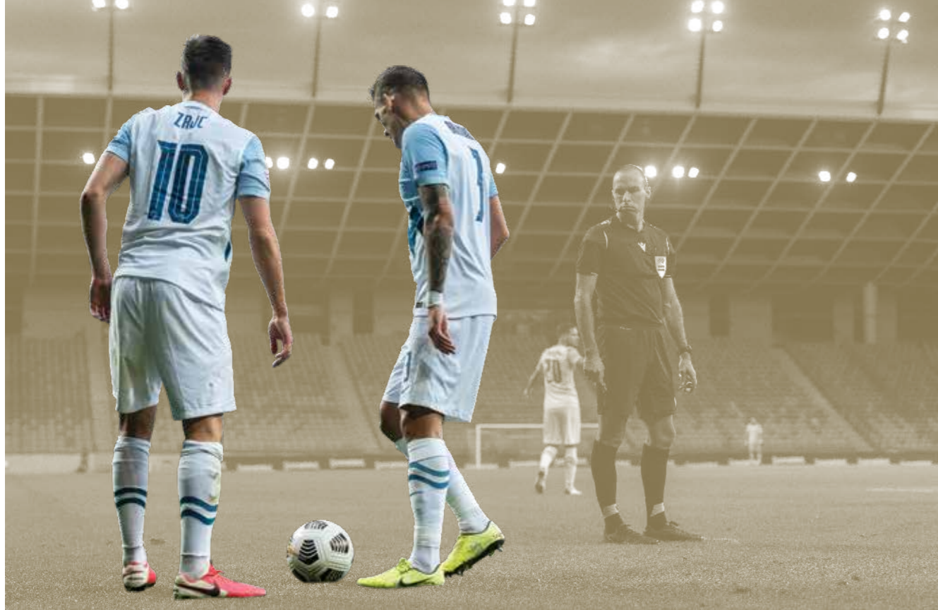
U3: Uravnoteženo poslovanje in vlaganje v razvoj nogometa

NAMEN: Z inovativnimi rešitvami in sodobnimi tehnologijami ustvariti pogoje za ohranjanje ravni prihodkov v nogometu tako za razvoj vrhunškega nogometa kot nogometa za vse deležnike. V sodelovanju z lokalnimi skupnostmi in državo omogočiti izboljšanje nogometne infrastrukture za igranje nogometa na vseh ravneh. Sistematično vlagati v deležnike, njihovo delovanje in programe. Zagotoviti dodatna denarna sredstva za čim boljši razvoj mladih igralcev preko primerno plačanih in specializiranih trenerjev in demonstratorjev nogometne igre.